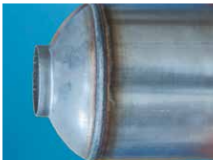
Sistema di scarico in acciaio inox ferritico