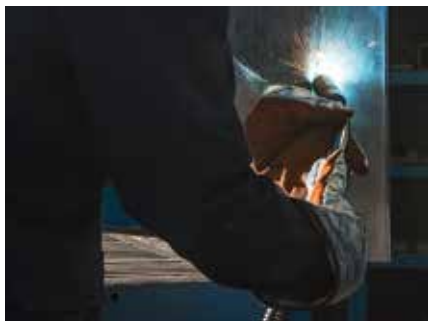
Saldatura in tutte le posizioni