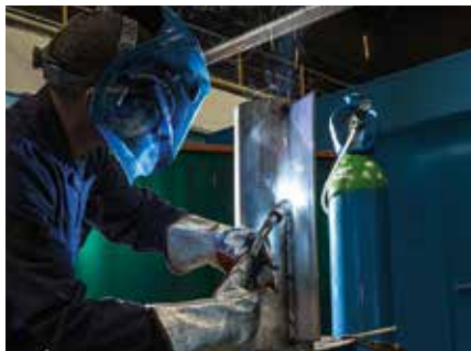
Saldatura MAG di acciaio inox

La soluzione ad alte prestazioni di protezione con gas per tutte le applicazioni MAG acciaio inox