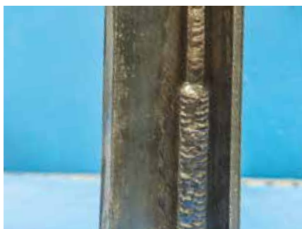
Saldatura multi passaggio - verticale

ARCAL™ Force è disponibile con le migliori modalità di fornitura per assicurare qualità, uniformità e facilità di utilizzo