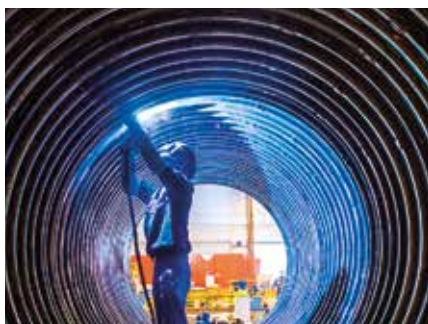
Adatto per spessori elevati