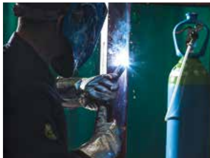
Saldatura MAG di acciaio al carbonio

La soluzione ad alte prestazioni di protezione con gas per saldatura MAG di strutture pesanti