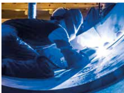
Saldatura TIG di acciaio inox