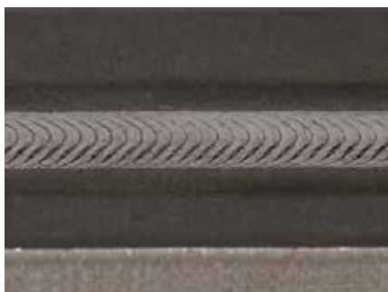
Saldatura al plasma del titanio