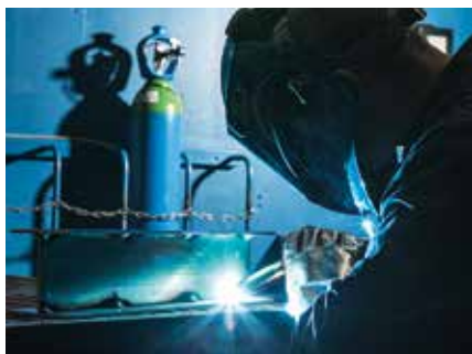
Saldatura MIG dell'alluminio

La soluzione ad alte prestazioni di protezione con gas per saldatura TIG e MAG di tutti i materiali